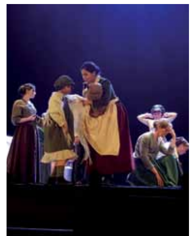
En el teatro Felipe Godínez tuvimos la oportunidad de disfrutar de una gran obra, situada también en la época, el musical Germinal que magistralmente retrata el inicio de los movimientos obreros y sindicales, la lucha por la igualdad, puesto en escena por el Liceo Municipal de la Música de Moguer