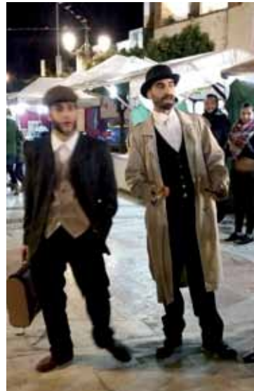
Personajes de la época de toda índole social