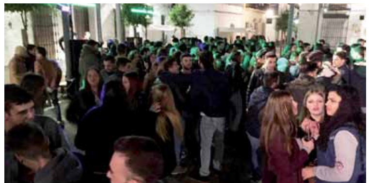
La juventud ha tenido también su protagonismo con espacios musicales y de ocio propios. En este marco pudimos disfrutar también del divertidísimo concierto de Los Elegidos quienes, con su irreverencia, nos hicieron olvidar el gélido frío del sábado por la noche