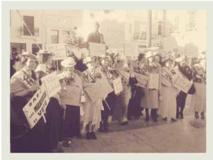
Por las calles de Moguer han paseado bandas, sufragistas reclamando el derecho al voto