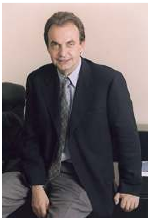
El Presidente del Gobierno de España ha aceptado formar parte también de dicho Comité.

En cuanto a la representación moguerense, finalmente, el Alcalde de Moguer y Presidente de la Fundación Juan Ramón Jiménez, ha aceptado la invitación formal para integrarse en el Comité Organizador. Así, Volante ha dado marcha atrás a la actitud beligerante que mantenía respecto a la comisión provincial. Se desdice así de todas las mentiras vertidas en el panfleto que repartió el PP sobre este asunto.